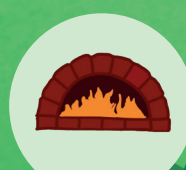
Four à pain