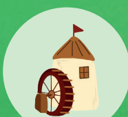
Moulin à aube