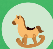
Jeux en bois

Buvette et restauration sur place, vente de pain cuit au four, expos et stands, associations, vente de produits locaux, troc aux plantes, vidéos et photos anciennes, animations